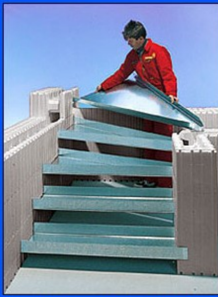
isorast-Treppe mit Wendelstufen